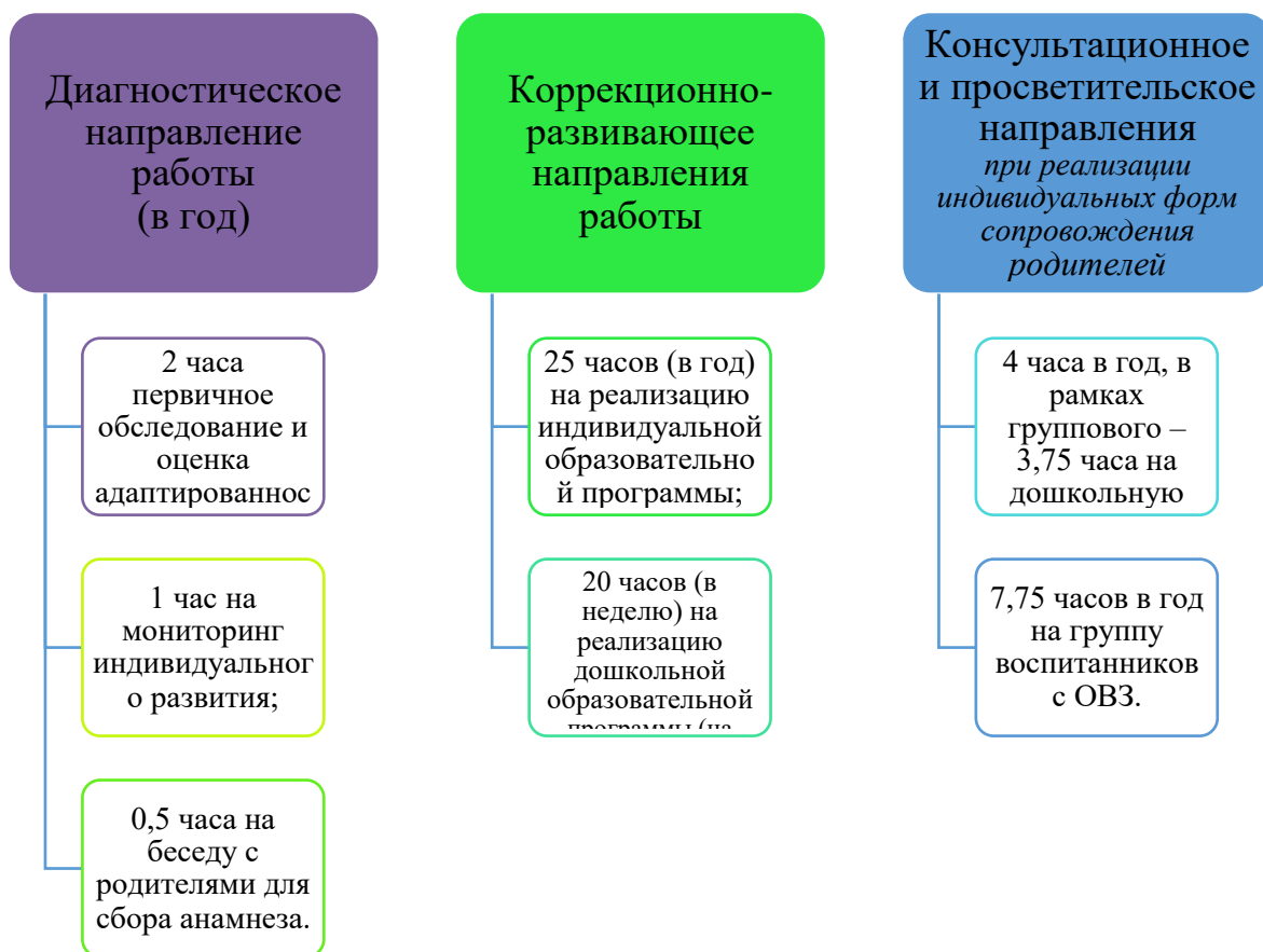
График организации образовательного процесса